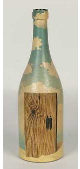
Bouteille peinte, 1942